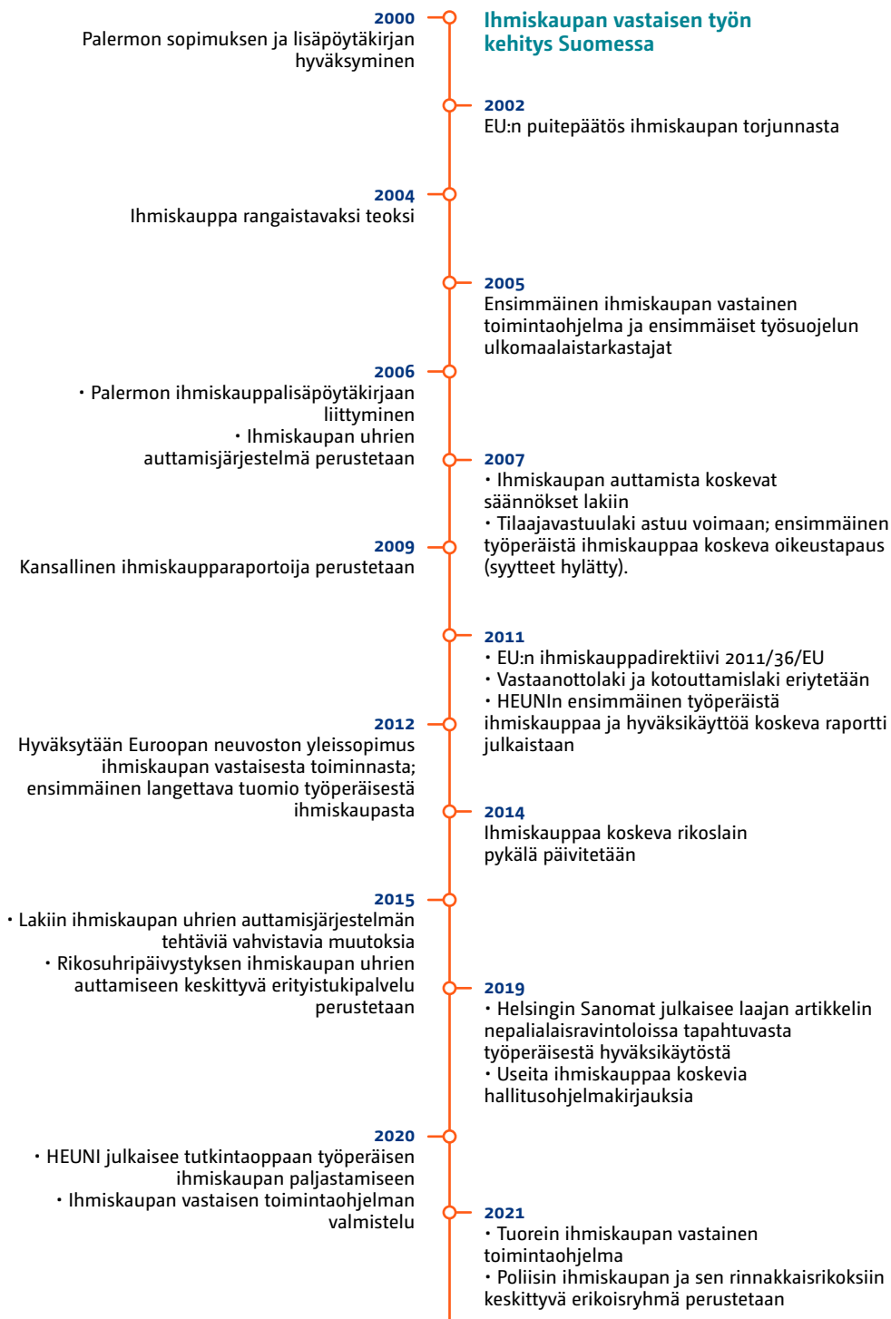
Kuva 1. Ihmiskaupan vastaisen toiminnan aikajana.